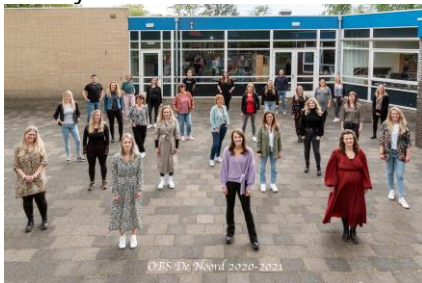
OBS De Noord 2020-2021

Voor u ligt de laatste nieuwsbrief van dit schooljaar. Een bewogen jaar. Door Coronamaatregelen hebben we ook dit schooljaar in een lockdown gezeten. Ondanks dat er maanden thuisonderwijs gegeven is, hebben de kinderen heel hard gewerkt. U als ouders/verzorgers heeft daar een groot aandeel in gehad. Nogmaals heel erg bedankt voor deze samenwerking. We gaan nu genieten van een welverdiende zomervakantie. We wensen iedereen een zonnige en ontspannen vakantie toe! En groep 8, veel succes op het voortgezet onderwijs!